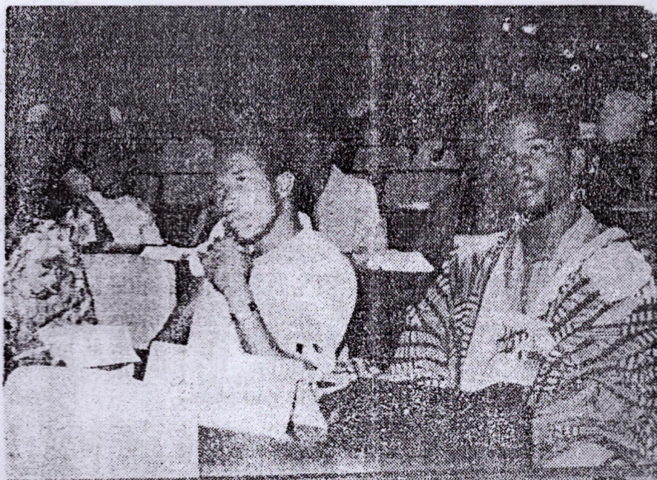
Une vue de la salle des Congrès pendant les travaux du 5e Congrès national de la J.R.D.A.